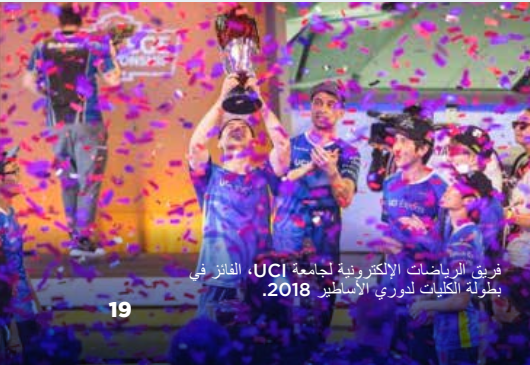
فريق الرياضات الإلكترونية لجامعة UCI، الفائز في بطولة الكليات لدوري الاساطير 2018.

إنّ جامعة UCI هي أول جامعة حكومية تُنشي برنامجًا رسميًا للرياضات الإلكترونية، ويعدّ البرنامج واحدًا من أفضل البرامج وأكثرها شمولاً في العالم. وفي صدارة الأنشطة التعليمية والبحثية المتعلقة بالألعاب، نجد جامعة UCI موطنًا لمجموعة من أكبر نوادي الألعاب في الدولة، كما أنها تضم مجتمعًا قويًا للغاية. نحن نساعد طلابنا على الارتباط بالشركات والوظائف في مجالات الألعاب والرياضات الإلكترونية. اكتشف هذه الرياضات بزيارة esports.uci.edu .